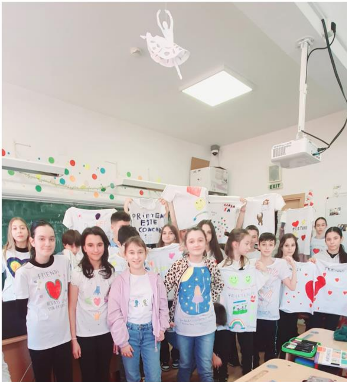
Școala Gimnazială nr. 311