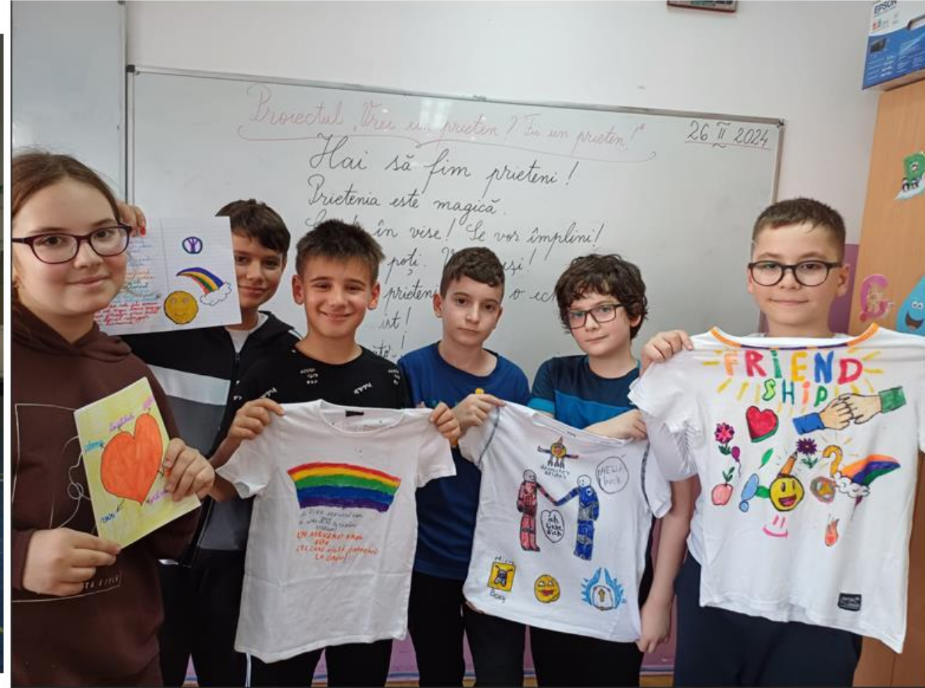
Liceul Teoretic „Ion Barbu“