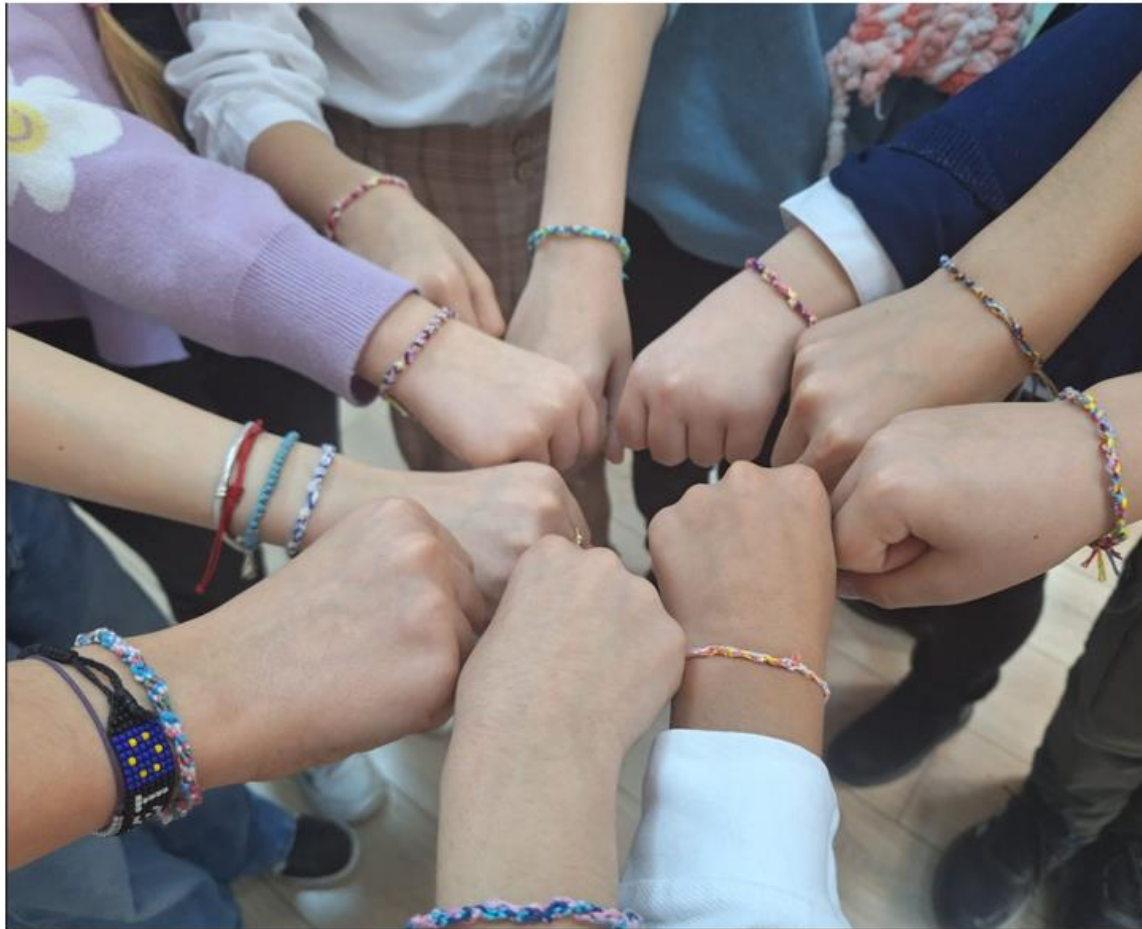
Colegiul Național „Elena Cuza“