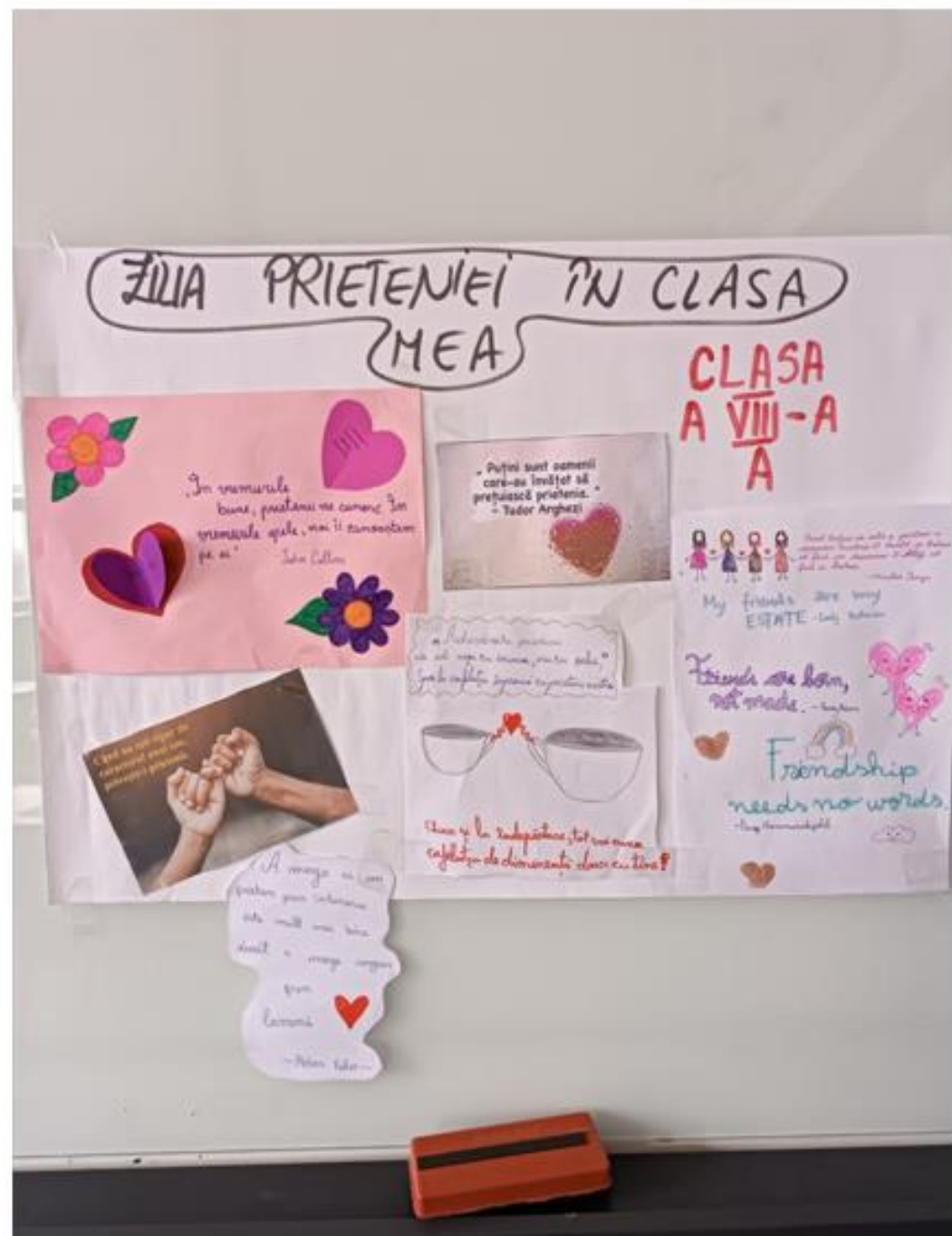
Școala Gimnazială nr. 86