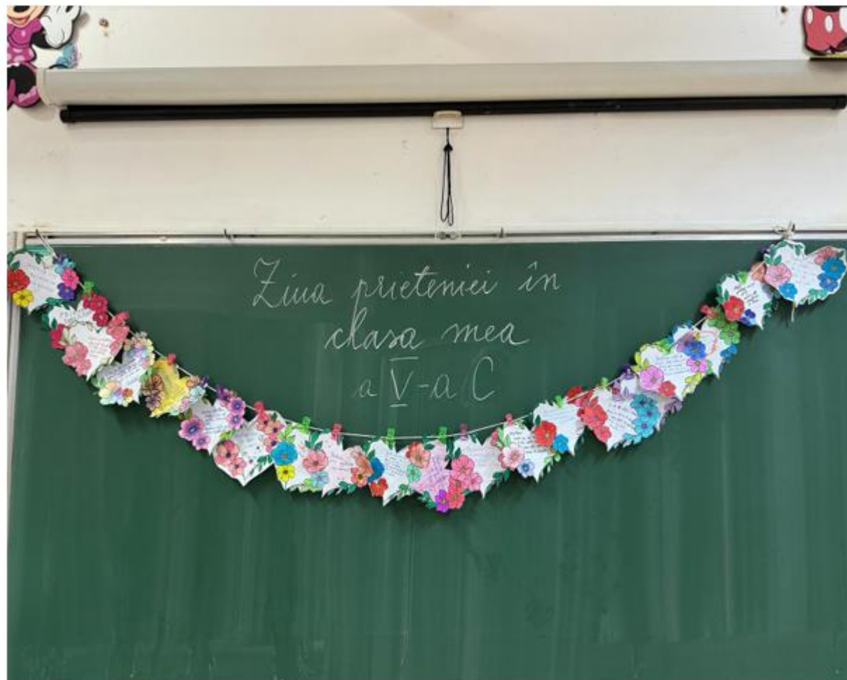
Școala Gimnazială „Avram Iancu”