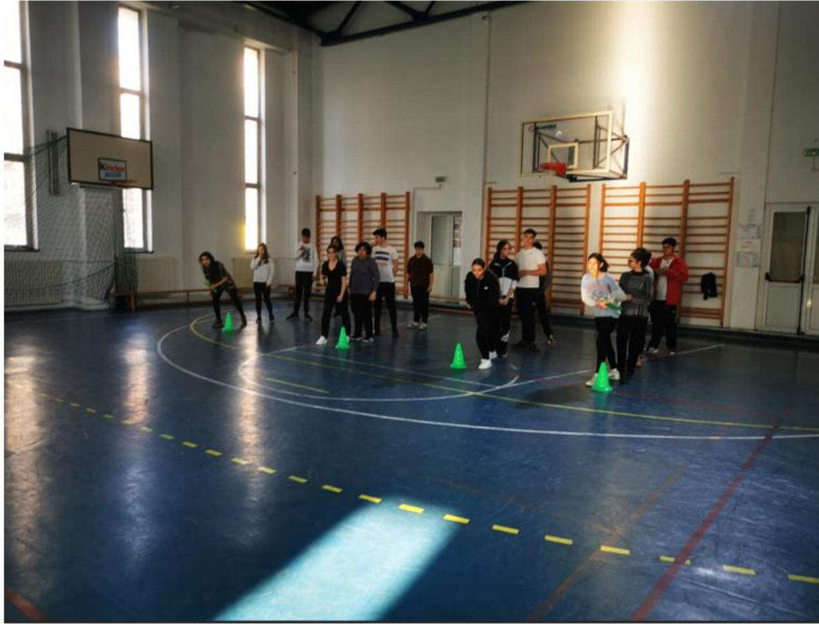
Liceul Teoretic „Ștefan Odobleja“