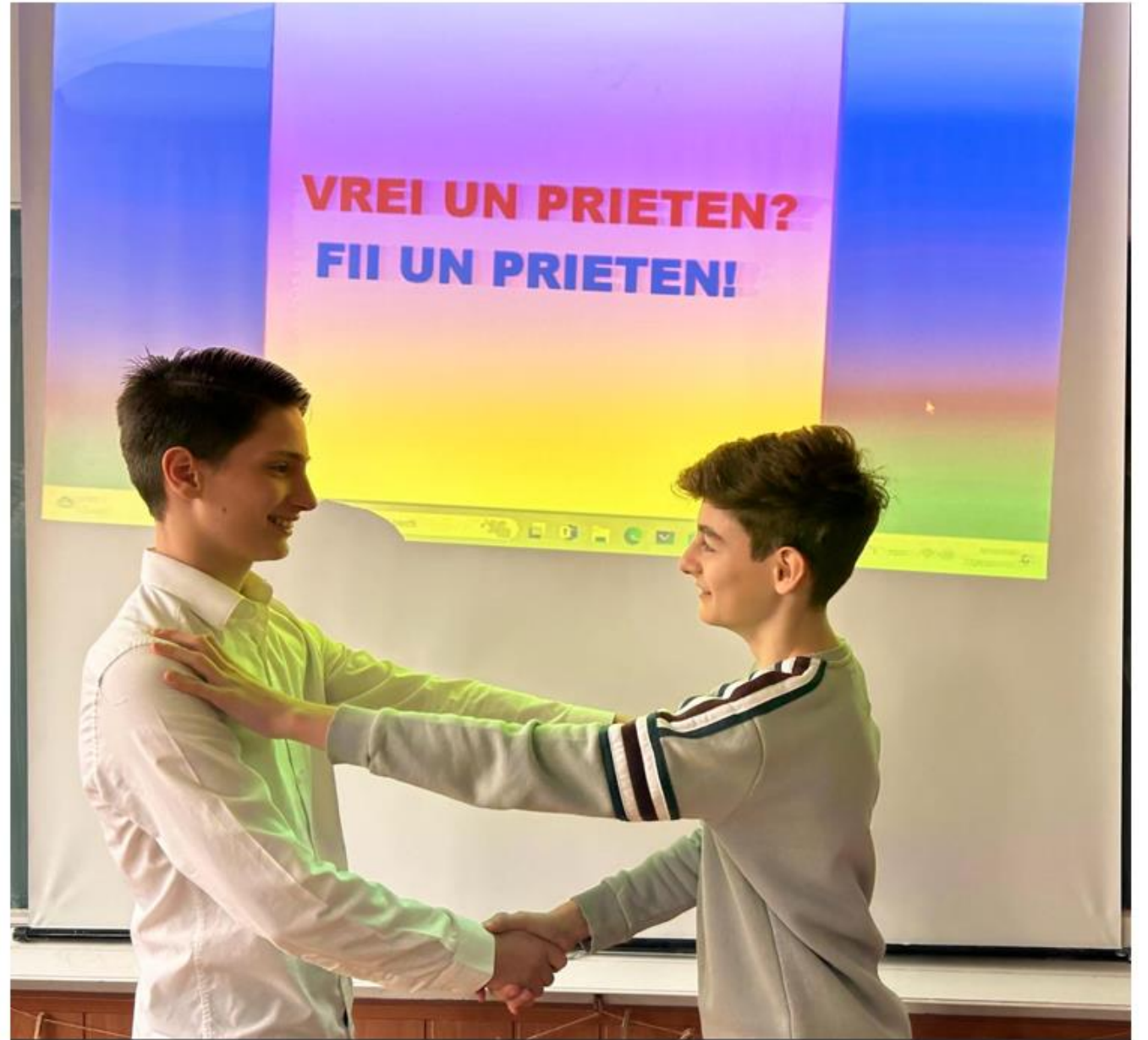
Școala Gimnazială „Principesa Margareta”