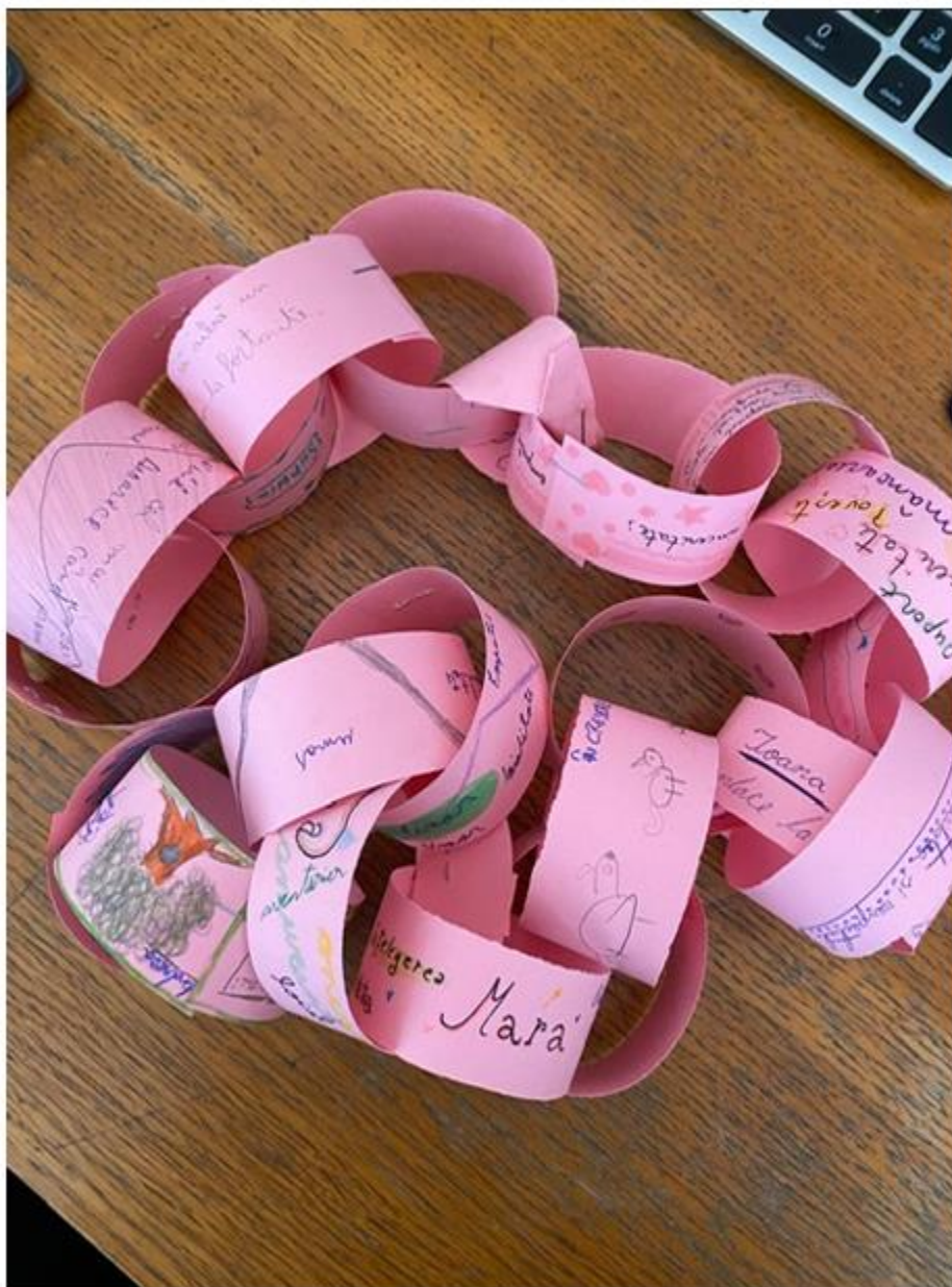
Colegiul Național „Școala Centrală“