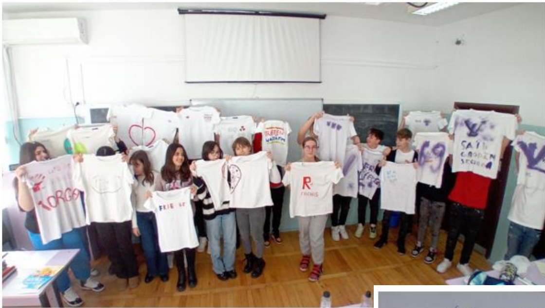
Școala Gimnazială nr. 131