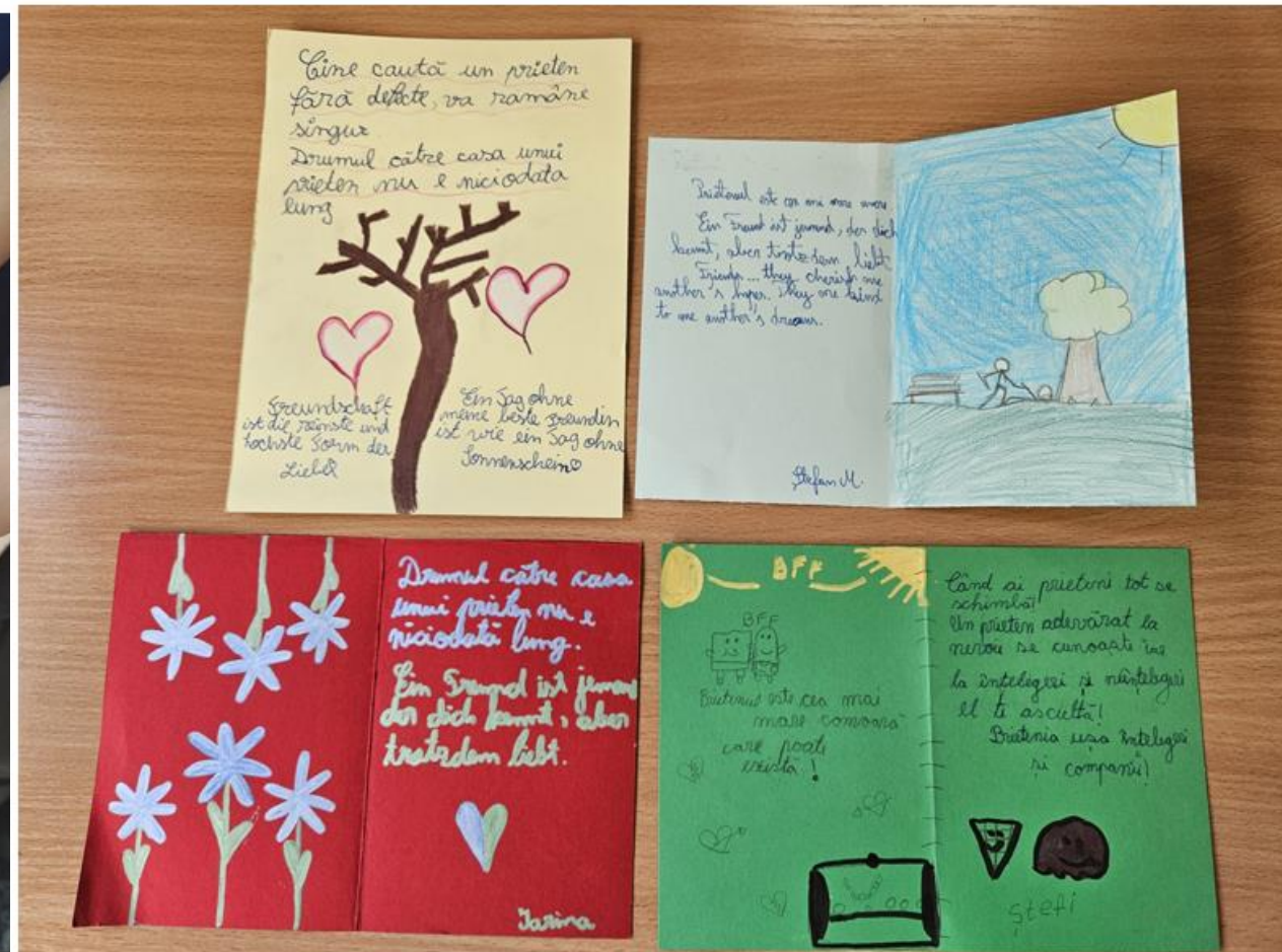
Colegiul German „Goethe“