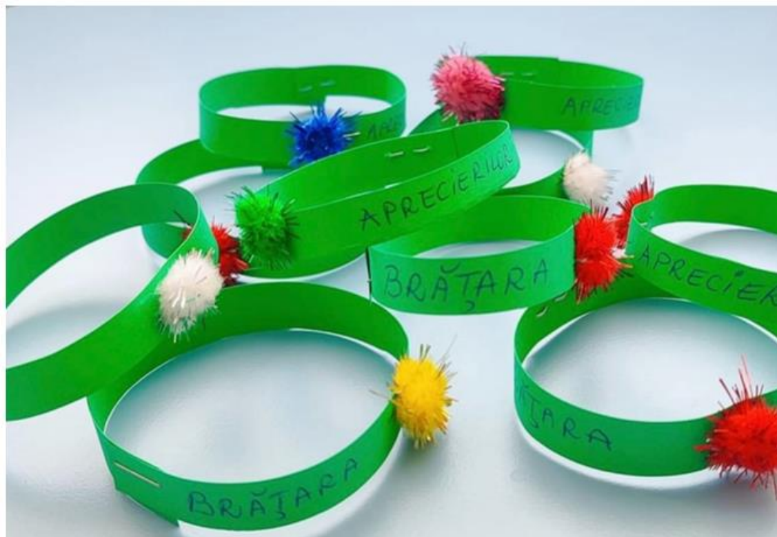
Școala Gimnazială „Al. I. Cuza”