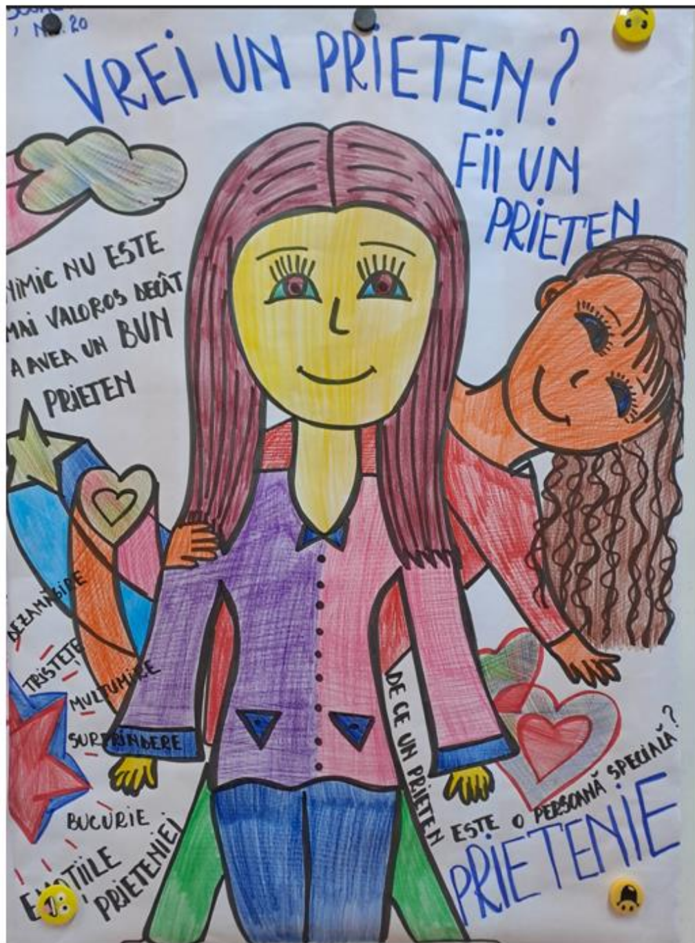
Școala Gimnazială nr. 20