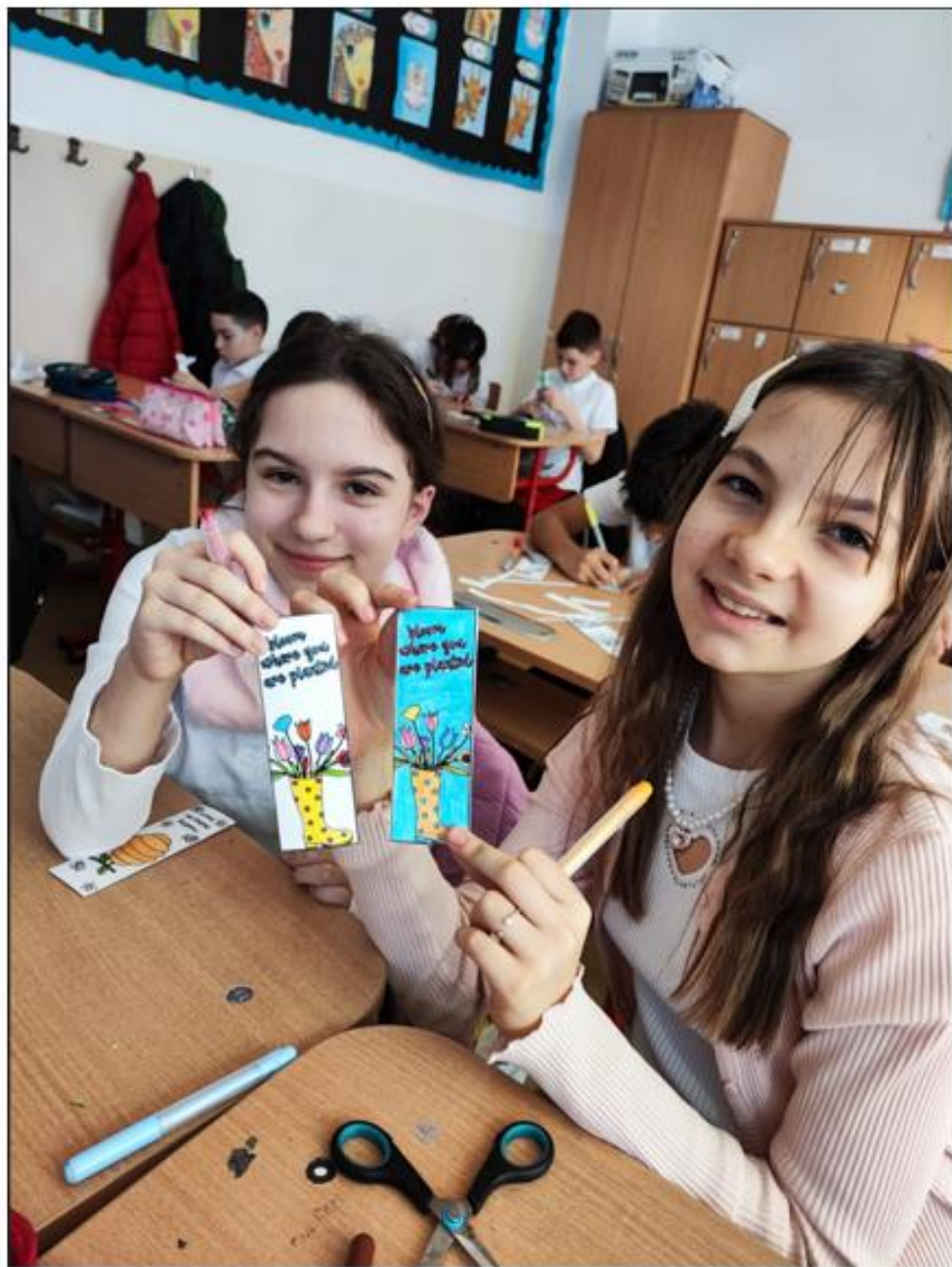
Școala Gimnazială „Emil Racoviță”