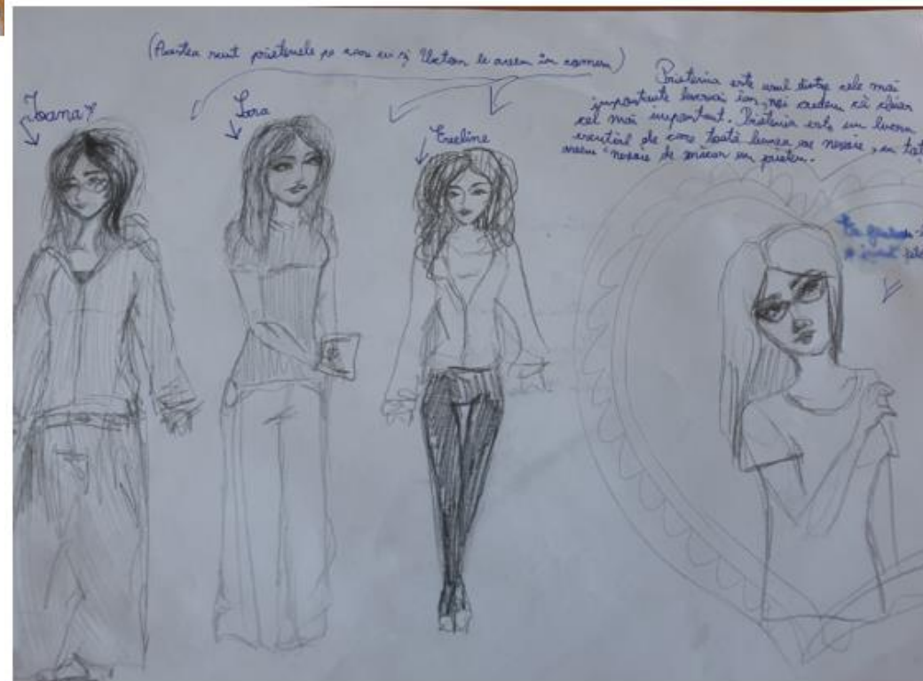
Școala Gimnazială nr. 195