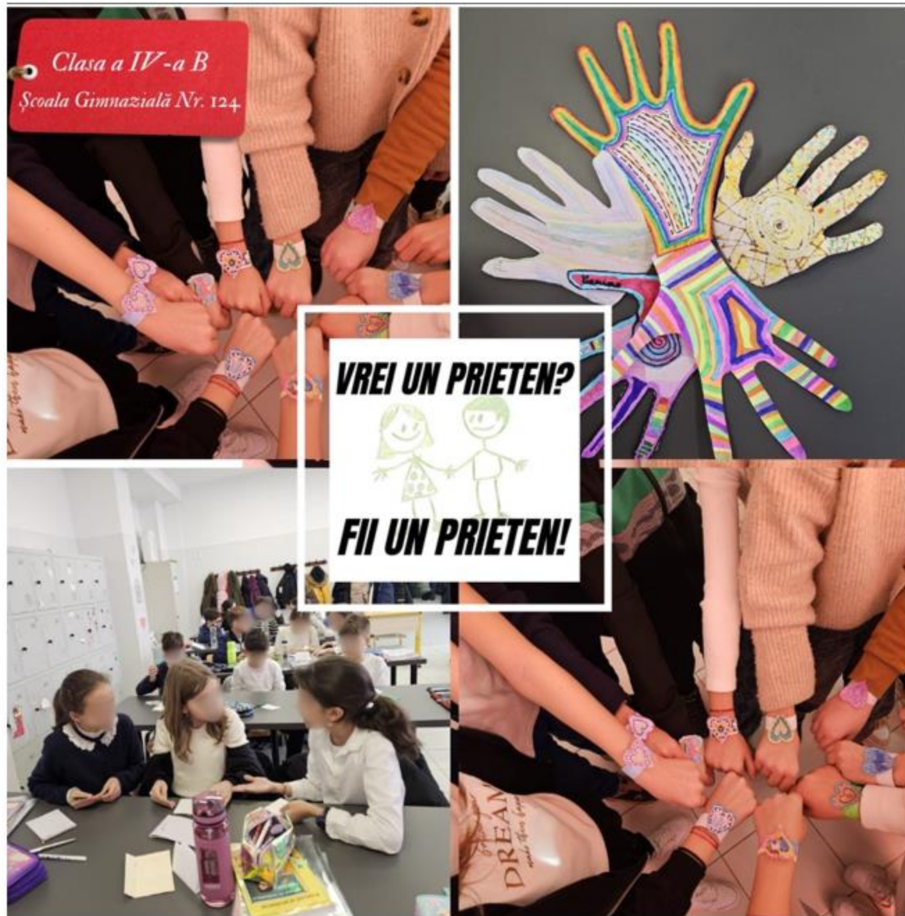
Școala Gimnazială nr. 124