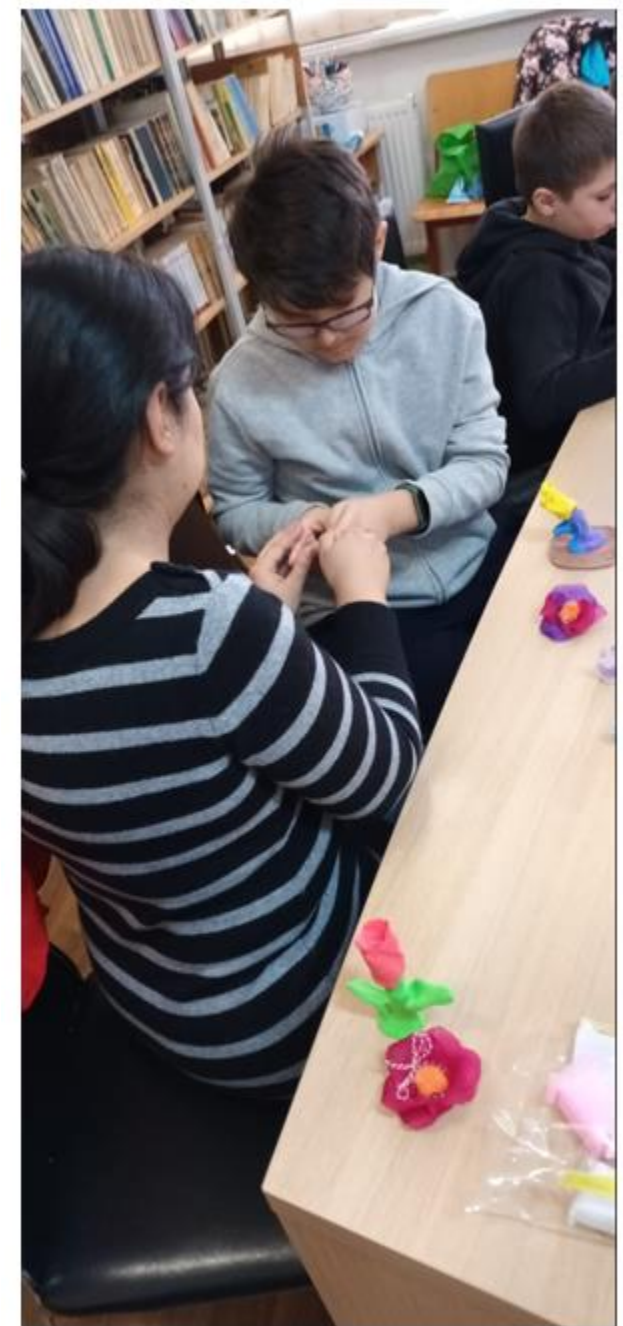
Școala Gimnazială nr. 190