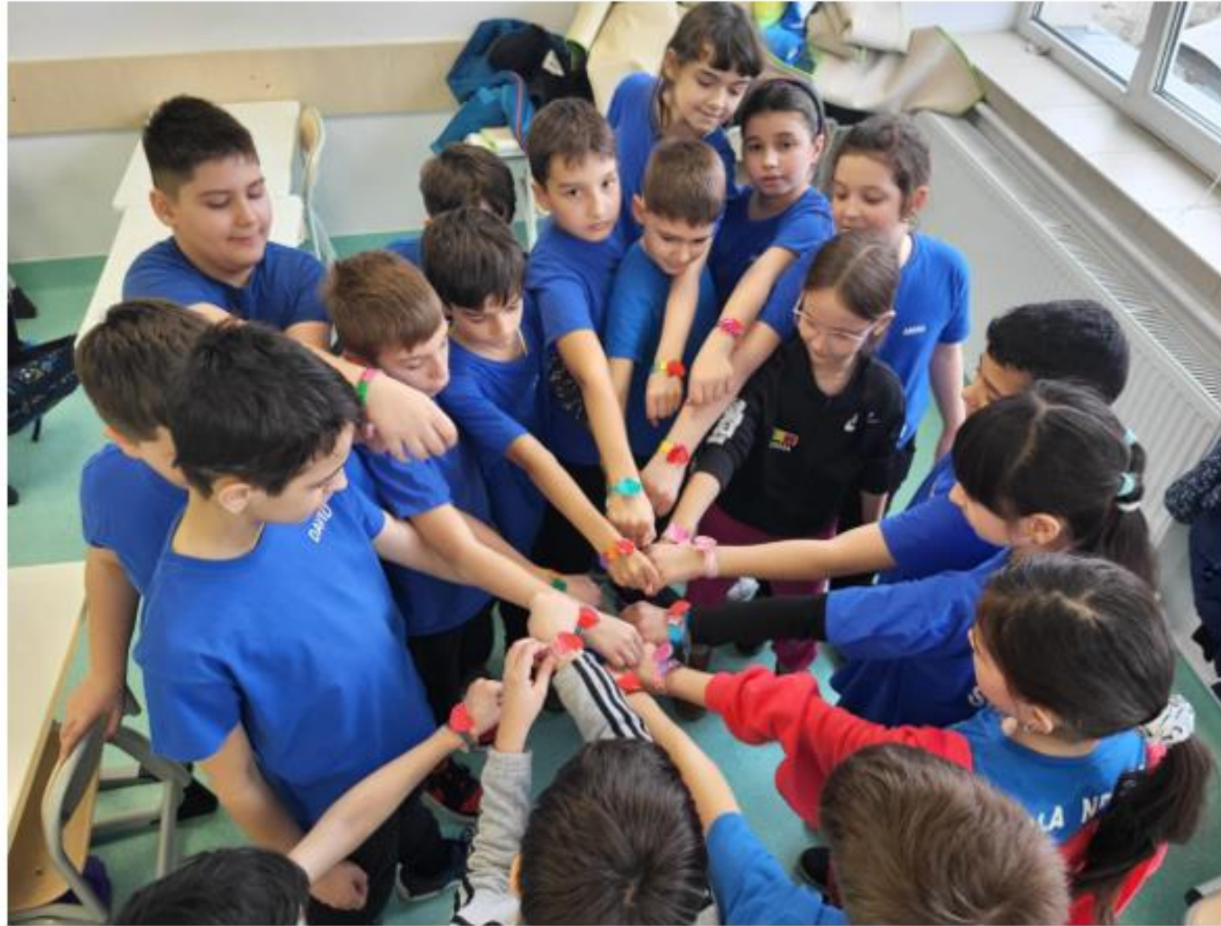
Școala Gimnazială nr. 280