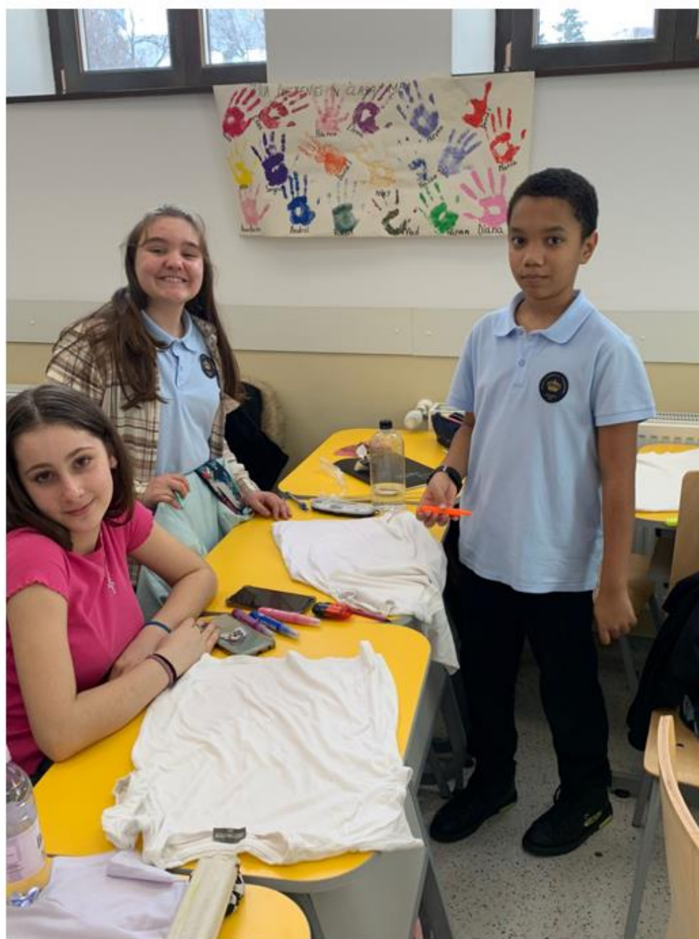
Școala Gimnazială „Ferdinand I”