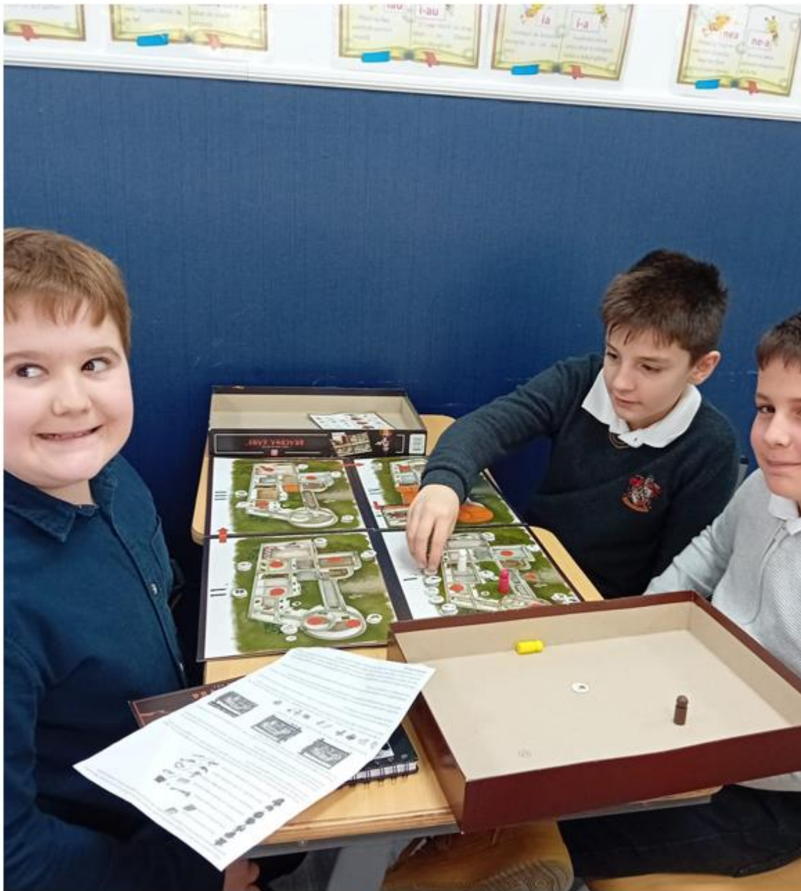
Școala Gimnazială nr. 97